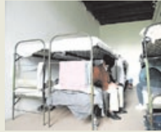
Die FP fährt eine eindeutige Linie bei Asylwerbern.

INNSBRUCK – Für den FP-Abgeordneten Heis ist klar, die von der EU geplante Richtlinie für Sozialhilfe an Asylwerber „höhlt das Sozialbudget weiter aus“. Die Gleichstellung sei abzulehnen.