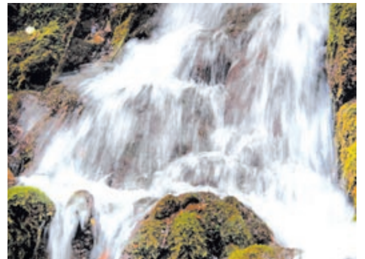
Für die Nutzung der Wasserkraft fordert das Land schnellere Verfahren bei der Umweltverträglichkeitsprüfung.

Vor allem für Fälle einer gesetzlichen Interessenabwägung wie für den Bau von Kraftwerken erwartet sich das Land eine besondere Regelung und eine Ergänzung des UVP-Gesetzes. Sollten überwiegende öffentliche Interessen für die Genehmigung sprechen, müsste nach Ansicht des Landes das Vorhaben genehmigt werden.