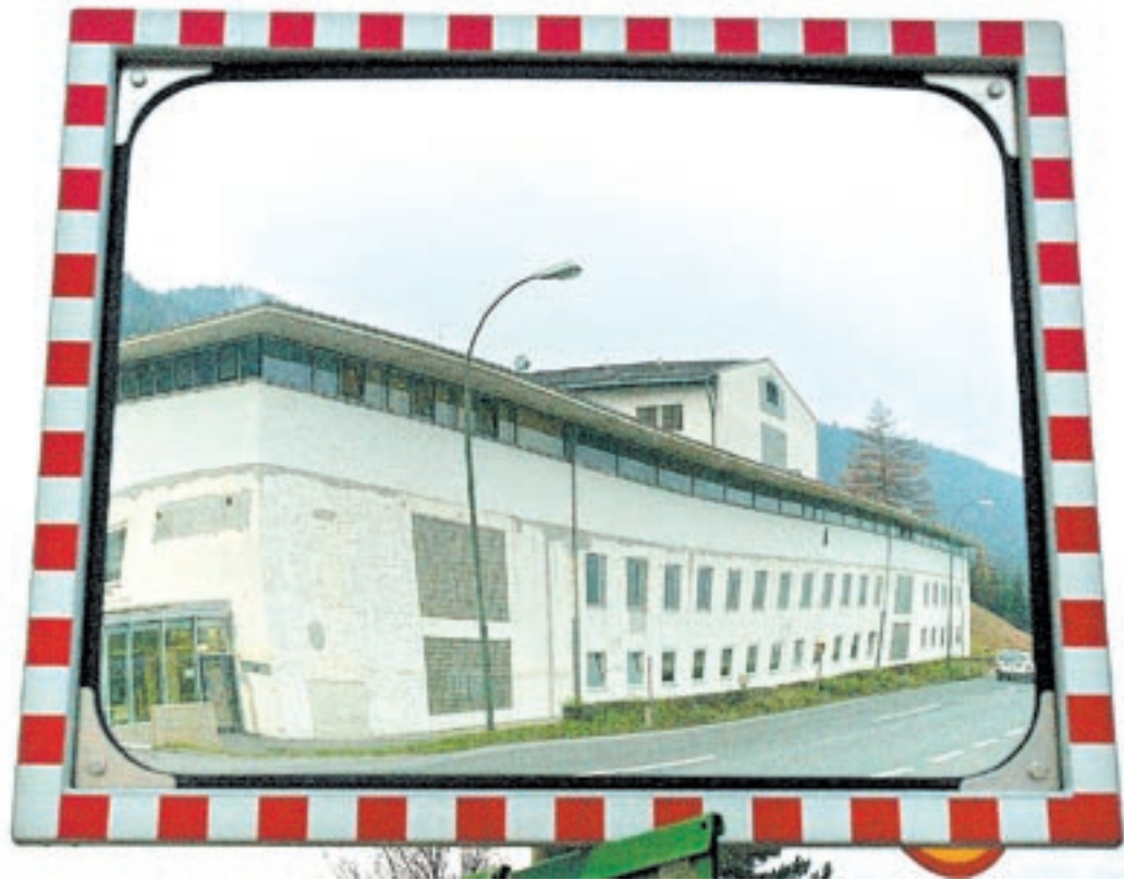
Das gesamte Personal der Justizanstalt wurde in den vergangenen Tagen untersucht.

BOZEN – Kein Einvernehmen konnte Südtirols Landeschef Durmwald mit der italienischen Unterrichtsministerin herstellen. Sie verweigert weiterhin die Bestellung des neuen Schulamtsleiters.